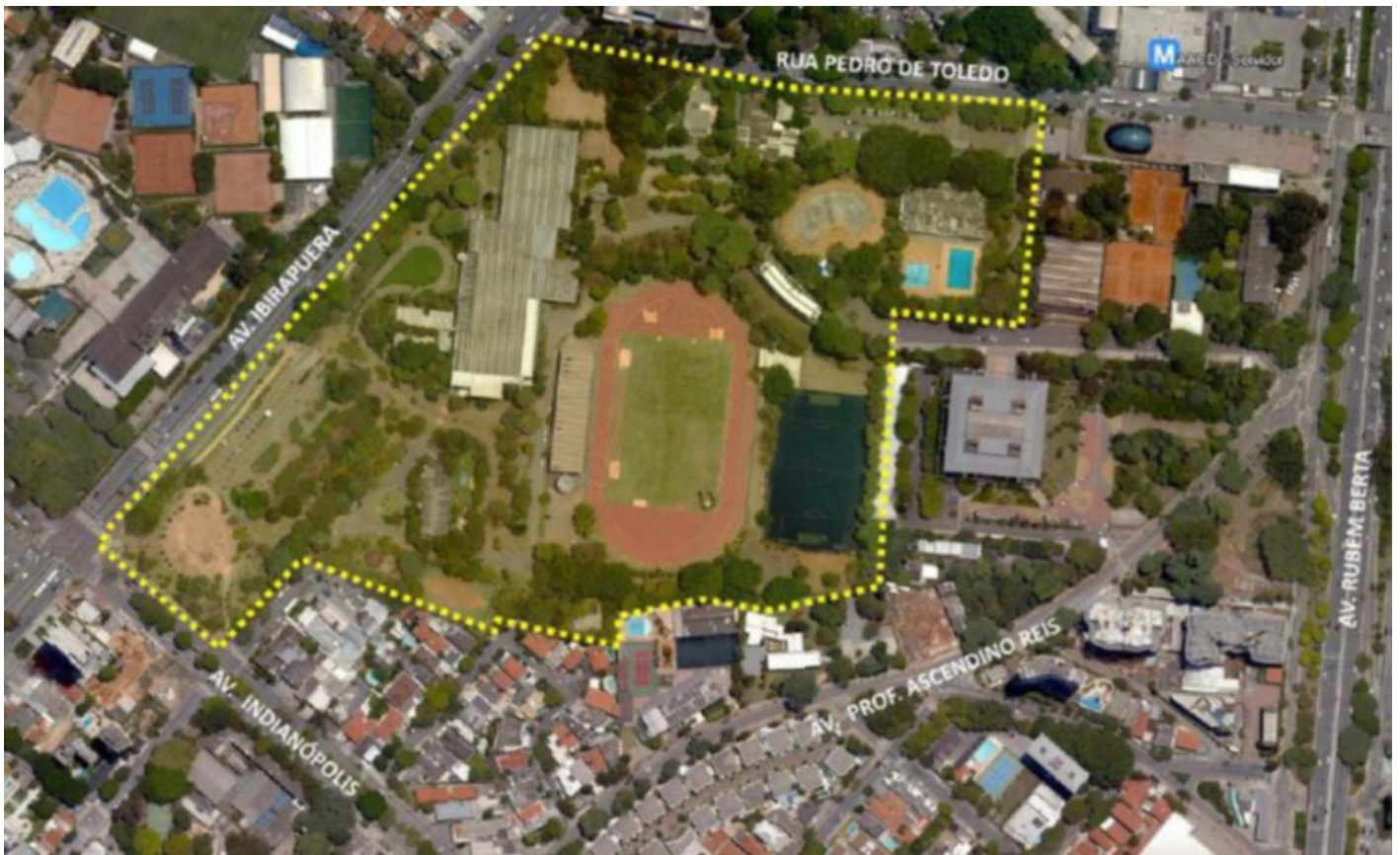
Figura 1 – Vista aérea da área onde será implantada a Arena Esportiva e o Edifício Garagem.

De acordo com os documentos disponibilizados para a consulta pública, “Como premissas do projeto, serão mantidos os equipamentos existentes como COTP, a pista de Atletismo, o Parque das Bicicletas, a pista de caminhada, entre outros, além de serem integrados fisicamente à nova edificação proposta”.