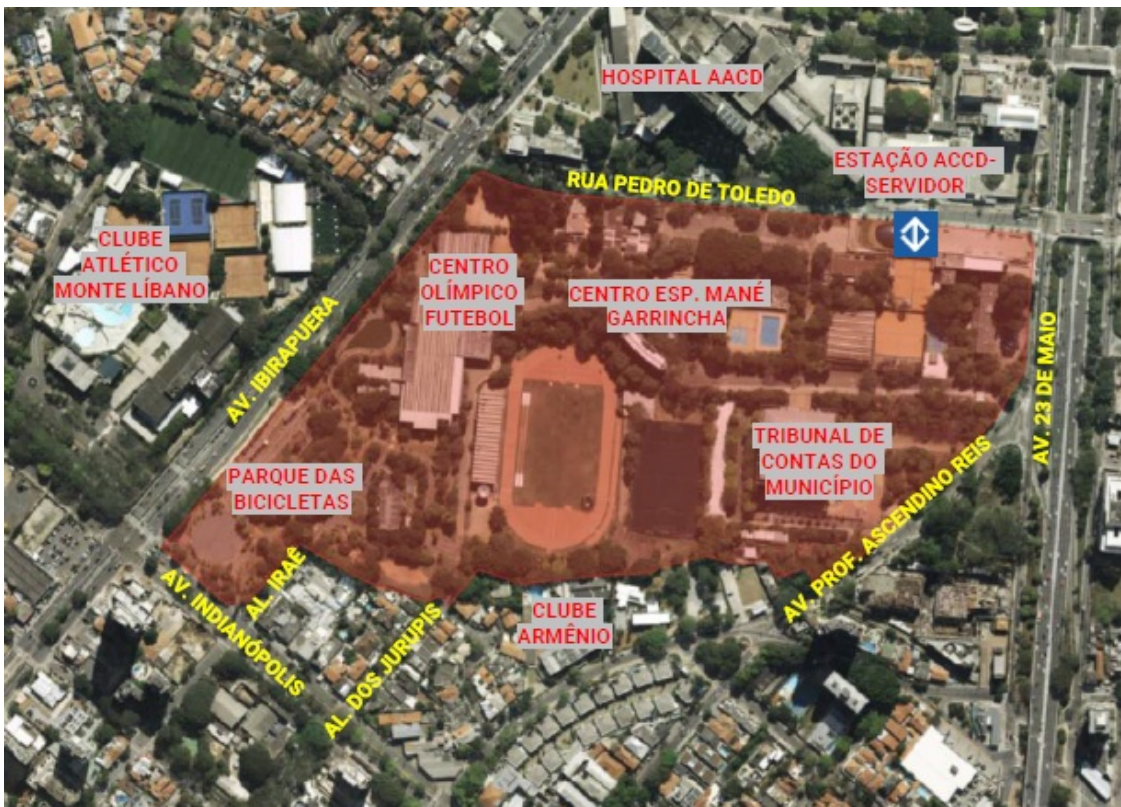
Figura 2 – Vista aérea da área dos equipamentos existentes na área onde será implantada a Arena Esportiva e o Edifício Garagem.